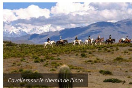
Cavaliers sur le chemin de l'Inca