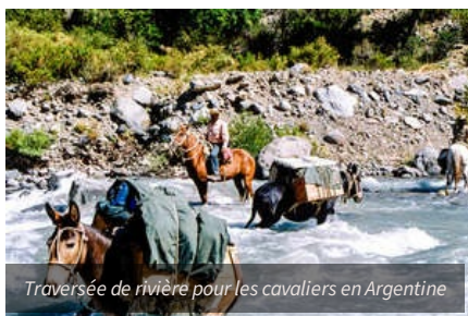
Traversée de rivière pour les cavaliers en Argentine