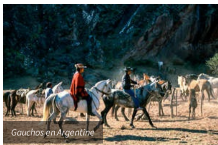
Gauchos en Argentine